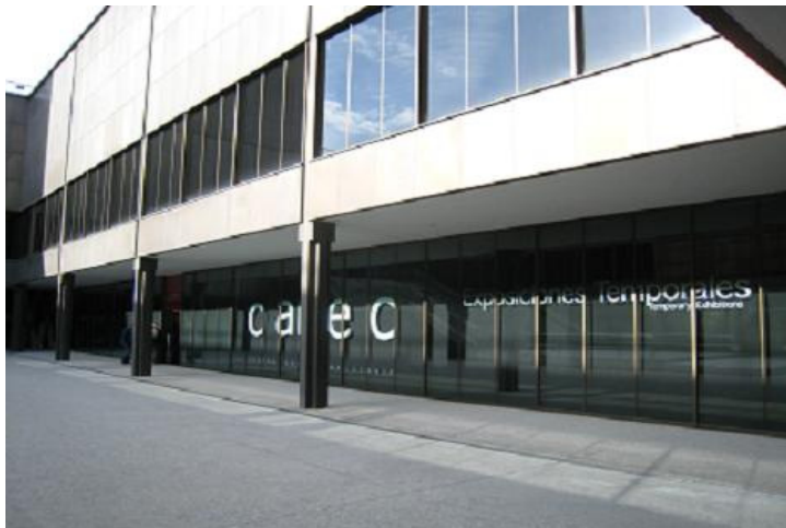
Vista del exterior