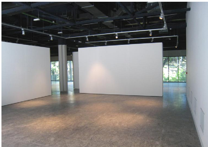
Vista del interior